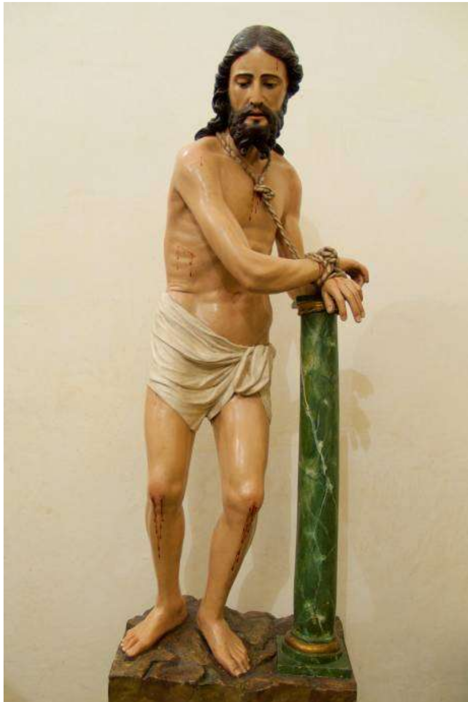
Jesús Flagelado, Juan Picardo, 1554, volverá a procesionar 60 años después en la Procesión de la Vera Cruz del Jueves Santo.